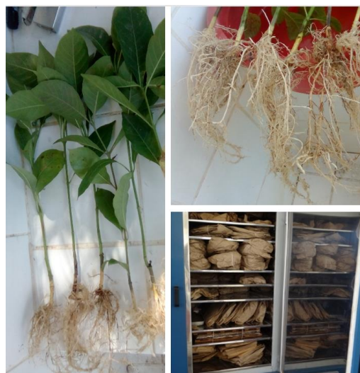
Figura 2. Separación de la parte aérea y de raíz de plantas de capirona y colocadas en estufa para determinar su masa seca.

fueron comparadas estadísticamente por la prueba de Tukey ( p \leq 0,05 ) a través del software SISVAR (Ferreira, 2011).