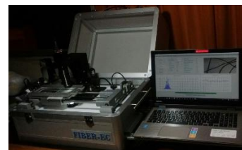
Figura 1. Fiber EC.

fibras por escaneo en un tiempo de 43 segundos. Tiene un peso y tamaño menor a otros equipos como el Laserscan y el OFDA2000, y puede trabajar en campo a elevadas altitudes, que es importante para su uso en camélidos sudamericanos que son criados principalmente en zonas alto andinas de Perú, Bolivia, Chile, Argentina y Ecuador. Asimismo el Fiber EC mientras realiza las mediciones muestra imágenes de fibras más nítidas que el OFDA 2000, permitiendo al usuario monitorear la evaluación en tiempo real. A la validación, realizado mediante comparación de resultados con valores conocidos de tops de lana y fibra de alpacas, el equipo tiene alta precisión, exactitud y repetibilidad. También sus mediciones tienen alta relación con las obtenidas con el OFDA2000 y el Laserscan.